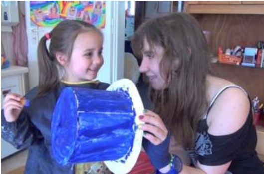
Kinder aus Kindergarten und Unterstufe