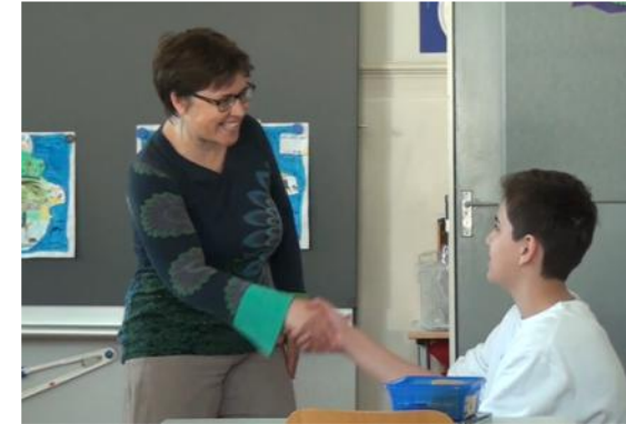
FLY Projektleitung und Coach Lehrperson Sek1; HeilpädagogIn, SSA